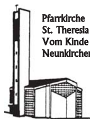
Pfarrkirche St. Theresia vom Kinde Jesu Neunkirchen

Pfarnachrichten der kath. Pfarrgemeinde St. Theresia vom Kinde Jesu im Pastoralverbund Südliches Siegerland